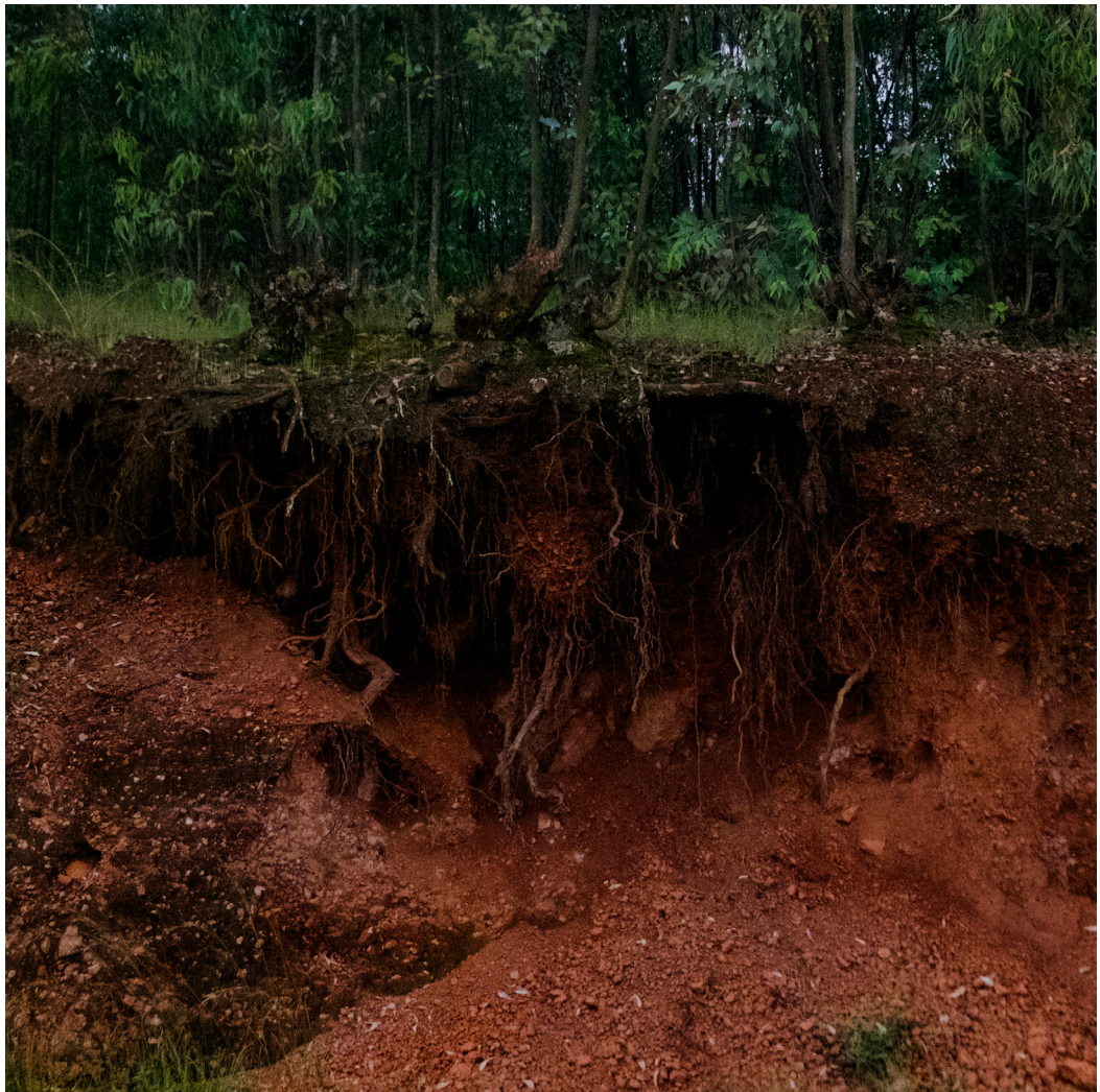
© Marie Moroni, « Racines », Série Ibaba, 40 x 40 cm, 2016

« J'ai prié pour la réouverture de l'atelier » m'a confié une femme du village...» et un jour, ce rêve est devenu réalité, 18 ans plus tard.