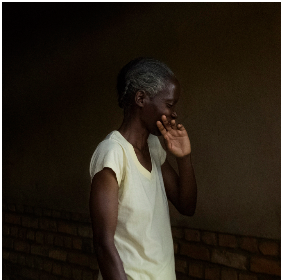
© Marie Moroni, « Daphrose », Série Ibaba, 40 x 40 cm, 2015

« J'aimerais broder des enfants, beaucoup d'enfants ». Le mari d'Emeritha a été tué lors du génocide, et elle n'a pas pu avoir la grande famille dont elle rêvait.