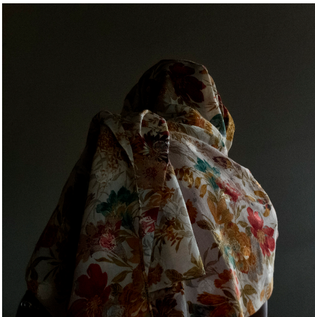
© Marie Moroni, « Fleurs », Série Ibaba, 40 x 40 cm, 2015

Vernissage le jeudi 25 janvier à partir de 19h