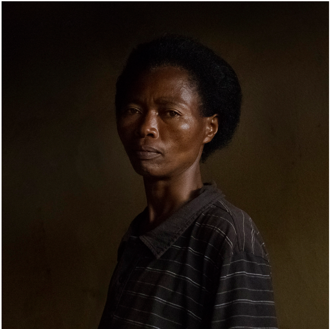
© Marie Moroni, « Joséphine », Série Ibaba, 40 x 40 cm, 2015