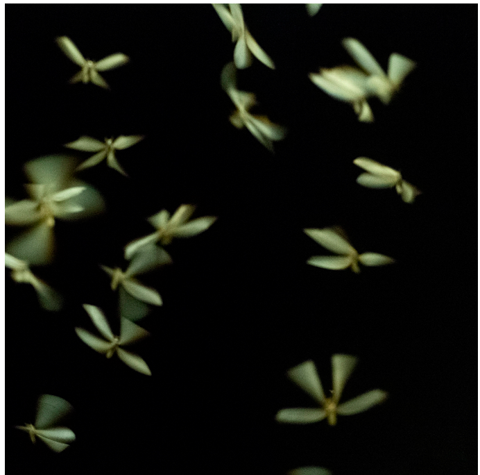
© Marie Moroni, « Éphémères », Série Ibaba, 40 x 40 cm, 2015

La VOZ'Galerie est membre de l'association Carré sur Seine.