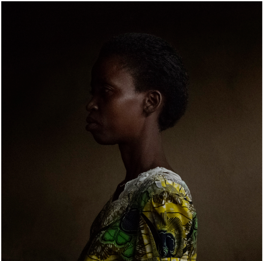
© Marie Moroni, « Eugenie », Série Ibaba, 40 x 40 cm, 2016

J'ai alors commencé à les photographier individuellement.