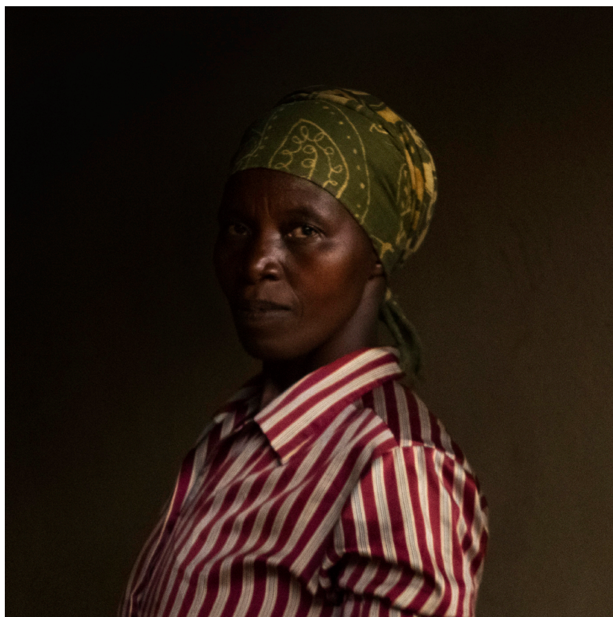
© Marie Moroni, « Thassiene », Série Ibaba, 40 x 40 cm, 2015

J'ai été touchée par ces rencontres individuelles, par ce qu'elles ont acceptés de me laisser entrevoir, à moi l'étrangère. Je ne parle pas leur langue, ni elles la mienne. Elles et moi, nous nous observons.