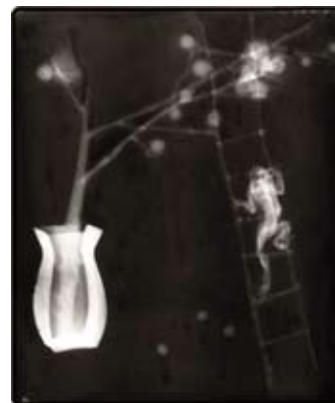
Caï Hongshuo, «Ladder to the Heaven»

L'œuvre de Caï HONGSHUO est surnaturelle, l'âme est passée au crible du diagnostic par l'utilisation de l'imagerie médicale. La radioscopie se fait l'indiscret révélateur de la pensée de l'artiste. L'œuvre se fait poème. L'invisible, composé des trois mondes (végétal, animal et objectal), est révélé à chacun par la technique de l'ombre chinoise. Elle projette sur un film des formes et silhouettes dont la luminosité ou l'opacité résulte de leurs différentes capacités à absorber les rayons X.