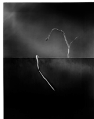
Sébastien Redon-Lévigne, «Bouquet de nerfs #1»

La tension qui règne dans l'œuvre de Sébastien REDON-LEVIGNE paralyse l'objet qui, pris par la lumière dans un instant hors du temps, électrise le spectateur dans l'équilibre de ses humeurs. Bouquet de nerfs, bouquet de fleurs, paquet de nerfs. L'instantané rend hommage à la technique photographique, la scénographie au ballet contemporain. L'œuvre se fige dans sa danse et nous offre l'expérience émotive de la prise de conscience des tensions musculaires et de la mise à nu des émotions, l'objet s'anime de bouquets d'émotions que la lumière rend sensoriellement perceptibles.