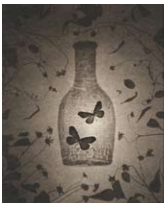
Ryuji Taira, «Two butterflies»